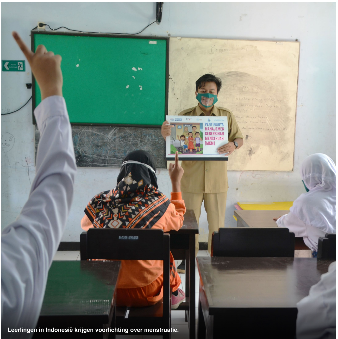
Leerlingen in Indonesië krijgen voorlichting over menstruatie.

Ook zet Plan International zich in om de toegang tot menstruatieproducten te vergroten. Zowel jongens als meisjes leren hoe ze zelf herbruikbaar maandverband kunnen maken. Plan International bouwt samen met scholen toiletten met speciale voorzieningen voor meisjes, zoals afvalbakken, watervoorziening en maandverband. Samen met andere organisaties lobbyen we bij (inter)nationale en lokale overheden ervoor om voorlichting over menstruatie een vast onderdeel van het onderwijscurriculum te maken. Met het Bloedelijk en Bloedserieus onderzoek vraagt Plan International aandacht voor de onbesproken problemen rondom menstruatie. Zo hebben we ook gelobbyd voor een door ons ontwikkelde ongesteldheids-emoji, een bloeddruppel , die sinds een paar jaar beschikbaar is in WhatsApp.