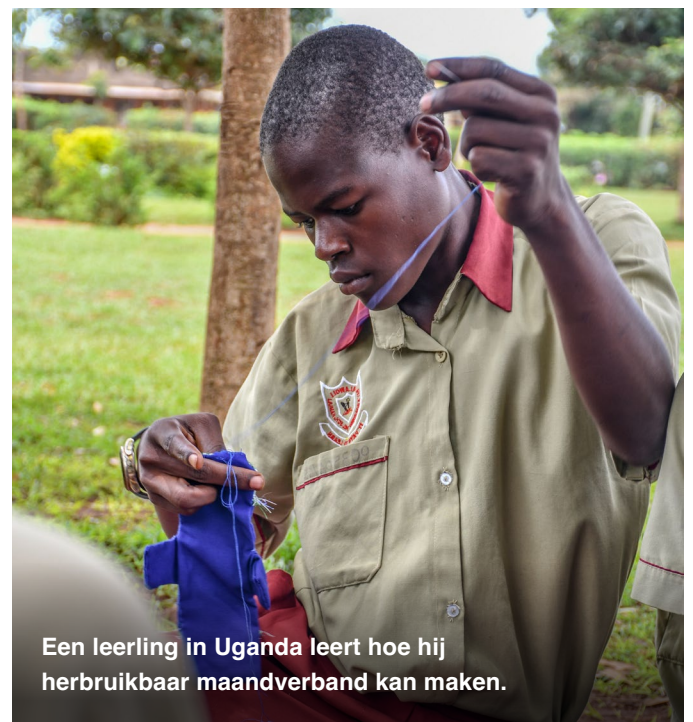
Een leerling in Uganda leert hoe hij herbruikbaar maandverband kan maken.