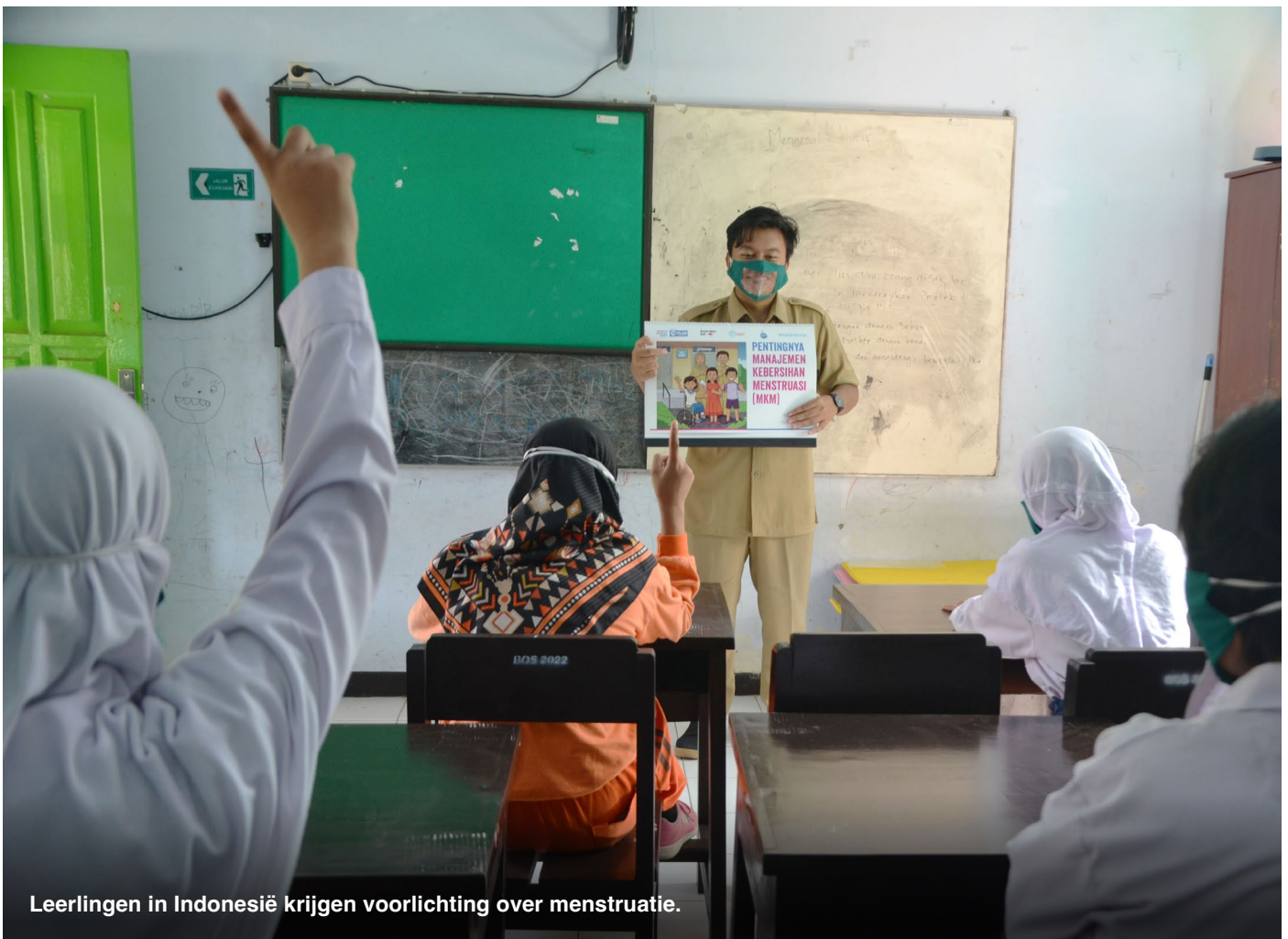
Leerlingen in Indonesië krijgen voorlichting over menstruatie.